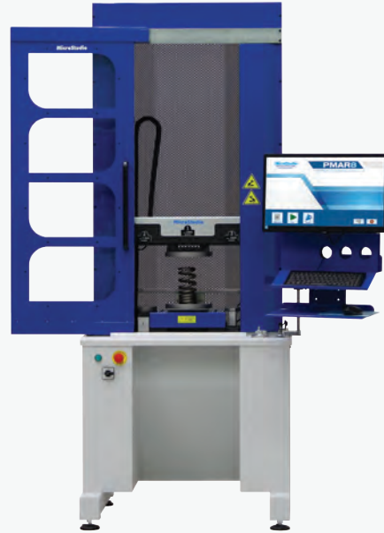
MXM25-1000 / MXM25-1800