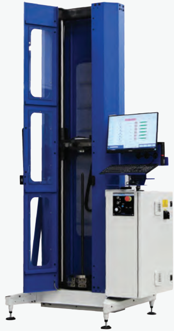
MXM6-1400 / MXM6-1800