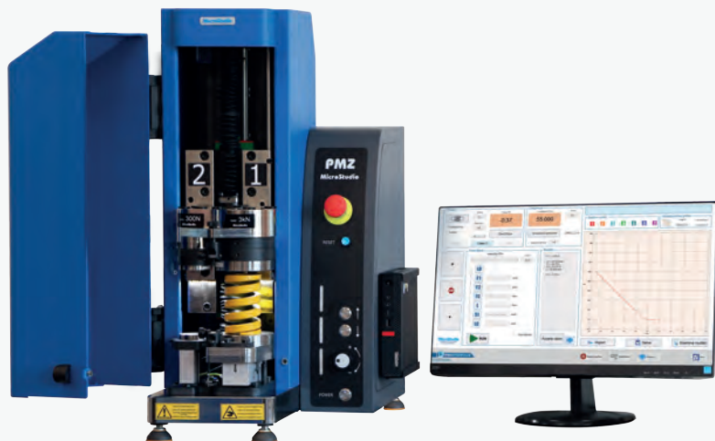
PMZDC1-300 / PMZDC2-300