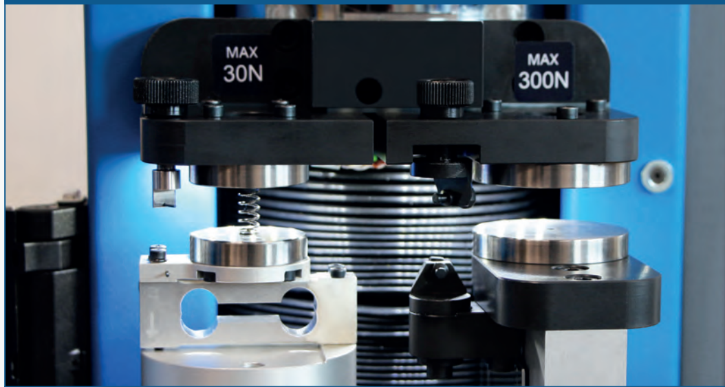
PMZDC1-300 / PMZDC1-500