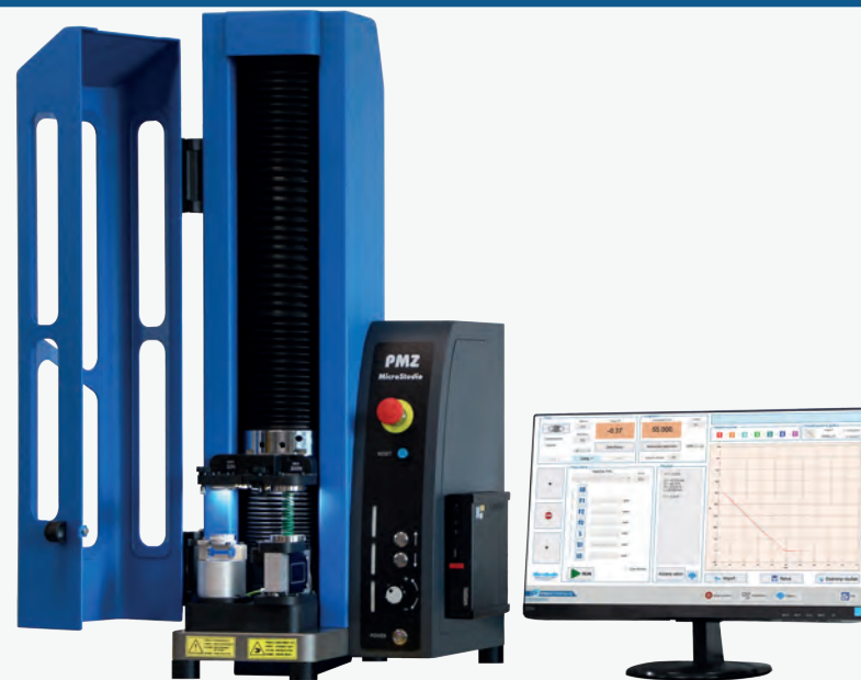
PMZDC1-500 / PMZDC2-500